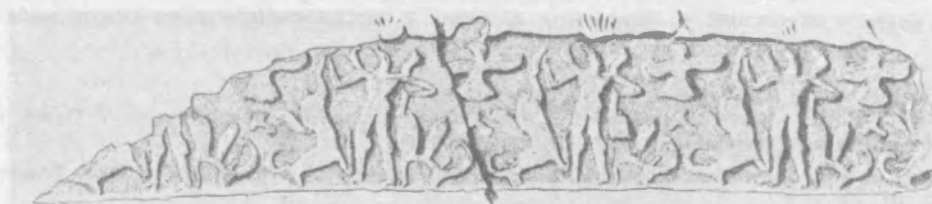
Рис. 2—3. Оттиск цилиндрической печати (фото и прорисовка)