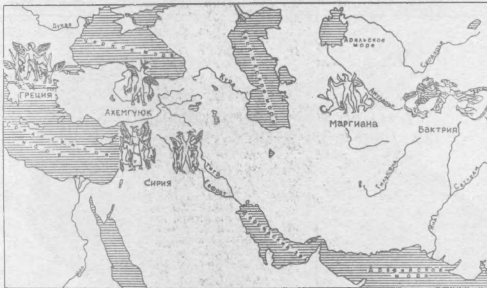
Рис. 4. Карта с распространением изображений крылатых птице-людей с поверженными животными

зверя 3 . Если учесть, что Бактрию и Маргиану заселили пришедшие сюда с запада родственные племена с близкими мифологическими представлениями, то станет очевидным, что оба эти изображения (бактрийский топор и оттиск цилиндрической маргианской печати) по существу представляют собой два варианта на одну и ту же тему. Б. Брентьес, рассматривая бактрийский топор, сразу и безоговорочно определил его «митаннийский стиль»; его вывод поддержали и другие исследователи. Правда, Б. Брентьес предполагает, что направление культурного влияния шло с востока на запад 4 , но известные материалы не дают подтверждения такой точке зрения.